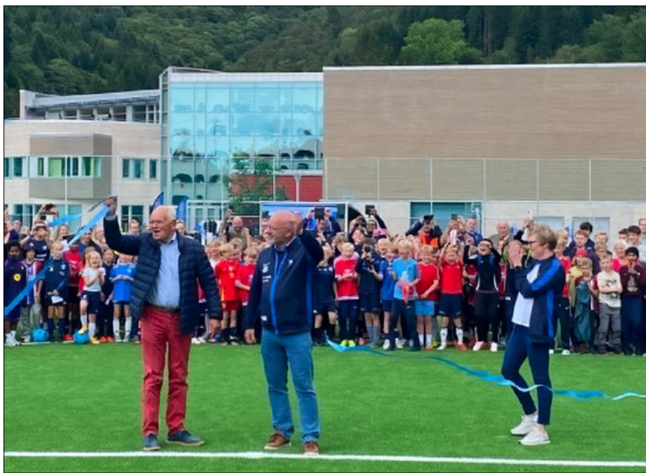
Åpning av Sædalen fotballbane.