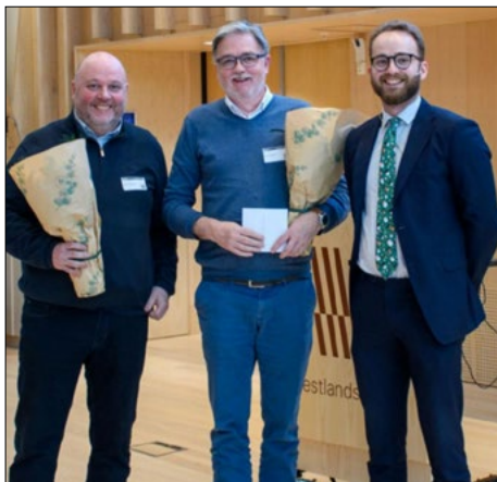
Smørås IL er årets idrettslag i Bergen.