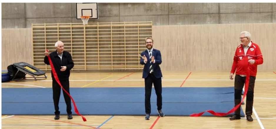
Snorklipping Alvøen idrettspark.