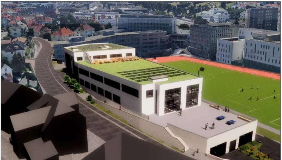
Idrettens hus, Krohnsminde

Det kan, med god planlegging, også utløse bedre anlegg for Krohnsmindealliansen som er Ny-Krohnborg IL, Bergen Kickboxingklubb, Bergen Rugby klubb og Idrettskretsen, og muligens andre potensielle brukere.