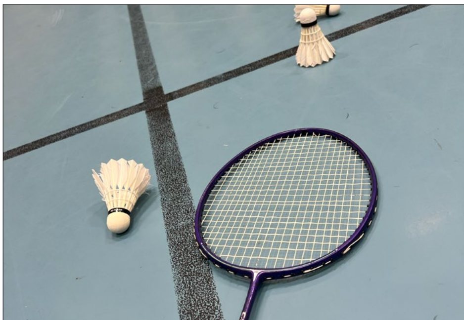
På LIM får barna prøve seg på ulike idretter, inkludert badminton. Utstyret kan også lånes gratis på BUA Årstad.